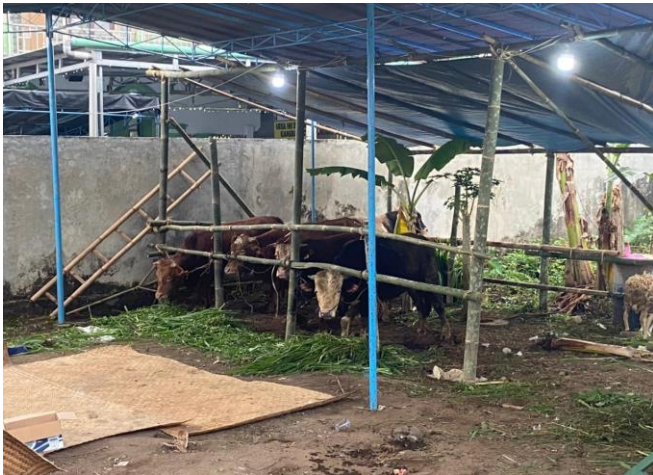
Gambar 2. Sapi Qurban

Kegiatan ini diakhiri dengan sesi diskusi dan tanya jawab mengenai penanganan daging kurban. Setelah itu kegiatan pengabdian ini ditutup dengan pemotongan daging kurban oleh panitia kurban Masjid Al Ikhsan Sanden. Hewan kurban yang akan dilakukan proses penyembelihan terdiri dari sapi dan kambing terdapat pada gambar 2 dan 3.