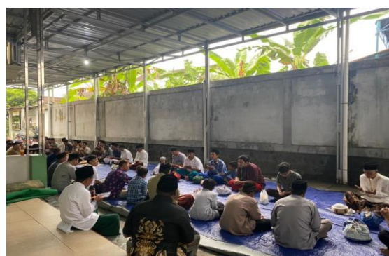
Gambar 1. Kegiatan pengenalan penanganan dan pengolahan daging kurban

Buku panduan yang disusun berisi tentang penanganan daging pada saat penyembelihan, pengolahan daging kurban seperti dendeng dan rendang, kandungan gizi dan manfaat dalam daging sapi dan kambing, keamanan daging kurban secara biologis, dan penjaminan halal daging kurban. Panduan kemudian diserahkan kepada pihak Masjid Al Ikhsan Sanden. Kegiatan pengenalan penanganan dan pengolahan daging kurban terdapat pada Gambar 1.